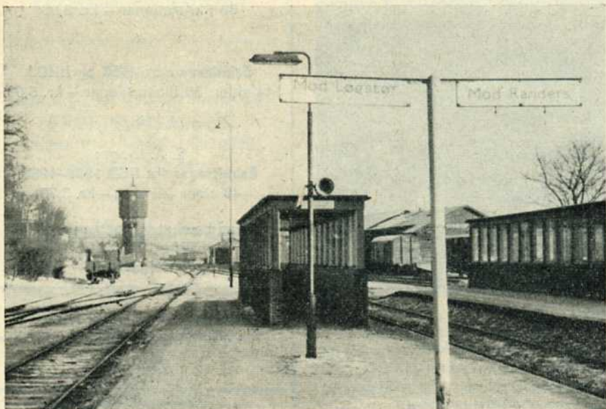
Hobro station perron 3

Herostratisk berømmelse er jævnlig til- lagt den midtsjællandske bane. Det var en herostratisk berømmelse, der blev følgen af den forkastelige gerning at stikke ild til Artemistemplet i Efesos år 356 f. Kr., men at det at anlægge den midtsjælland- ske jernbane også skulle være en Hero- stratos værdigt, er ikke klart indlysende.