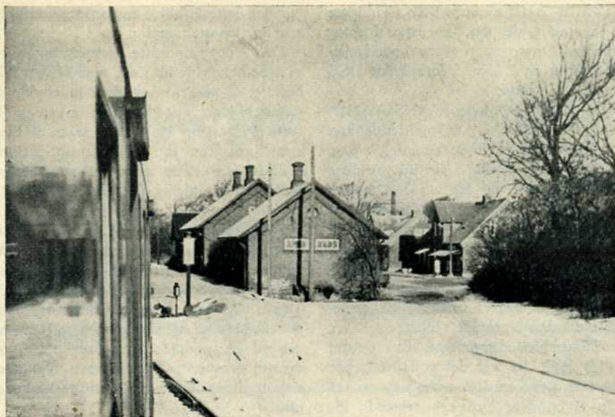
Vindblæs st. fra syd

Års: Stor by, stor godsudveksling, men også tiden afsat dertil. Minus en rejsende, men også plus en do., altså status quo ante. I Års er der også tid til at kaste et blik på niveauskæringen i stationens nord-